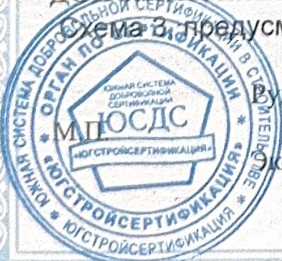
Схема 3, предусматривающая проведение инспекционного контроля не реже одного раза в год.